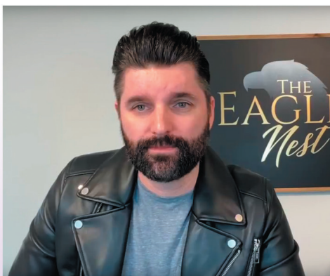
Пророк Чарли Шамп

да и да наклони везната в полза на свободата. Тя трябва да отвори устата си, да отсъди праведно и да защити правата на нищите. Църквата трябва да се вдигне и да разчуши духа на комунизъм, който се стреми да разруши една нация, намираща се под Моята ръка. Тя ще издаде своя указ и светлина ще блесне над праведните.“